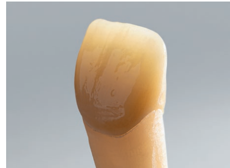
Herausragende ästhetische Eigenschaften