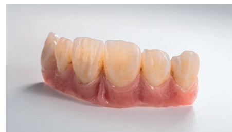
NexxZr+ weiss individuell infiltriert und verblendet