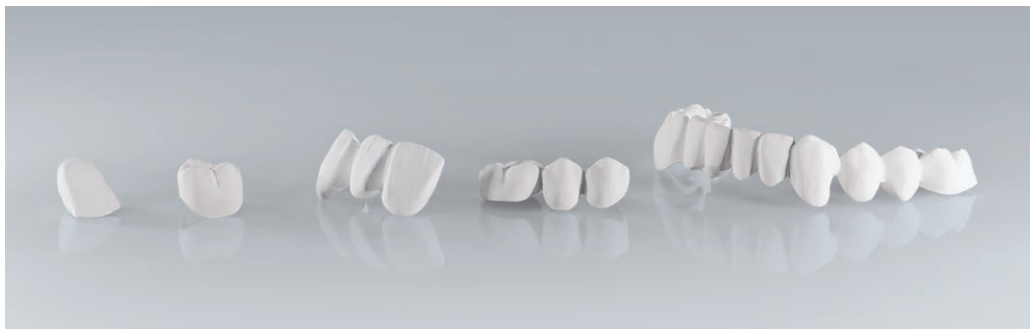
Einzelzahnrestauration bis mehrgliedrige Brücken