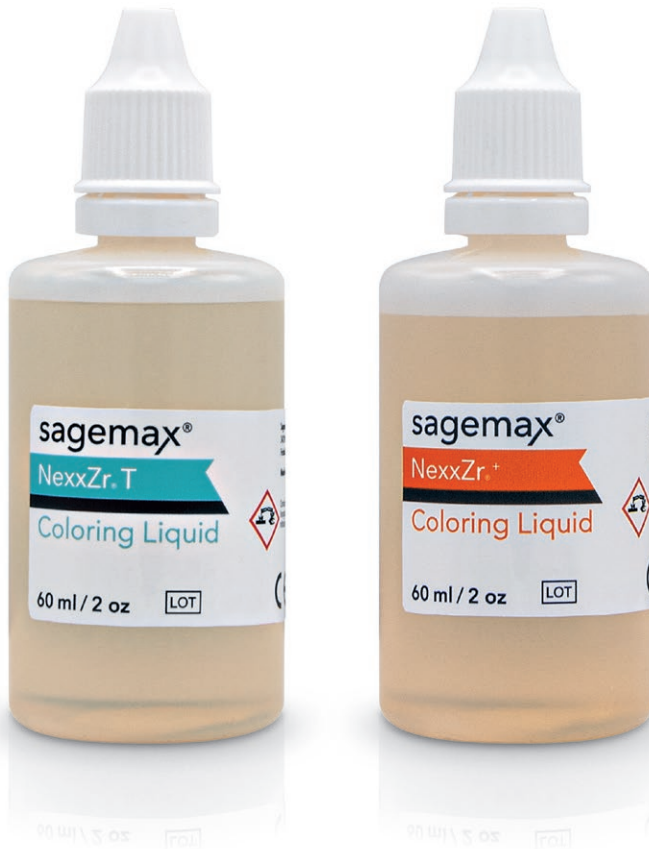
Wasserbasierte Infiltrations- liquids zur individuellen Einfärbung von NexxZr T (Weiss)