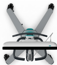
Weniger ausladende Rollen im vorderen Bereich